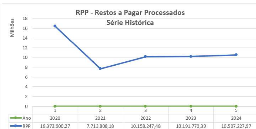
Gráfico 04 - Restos a Pagar Processado

De acordo com o art. 36 da Lei 4.320/64 os Restos a Pagar de Despesas Processadas são aqueles cujo empenho foi entregue ao credor, que por sua vez já forneceu o material, prestou o serviço ou executou a obra, e a despesa foi considerada liquidada, estando apta ao pagamento.