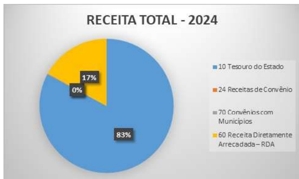
Gráfico 2 – Receita Total 2024 - Percentual de Participação por Fonte/Procedência