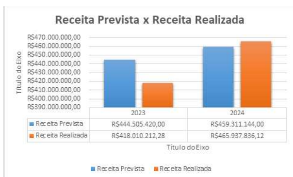
Gráfico 1 – Percentual de Receita Prevista / Receita Realizada