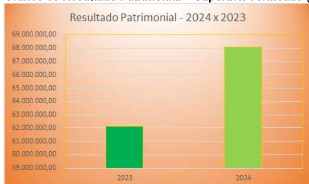
Gráfico 05 Resultado Patrimonial – Superávit Verificado (2023 - 2024)

Fonte: Demonstração das Variações Patrimoniais (2024/2023)